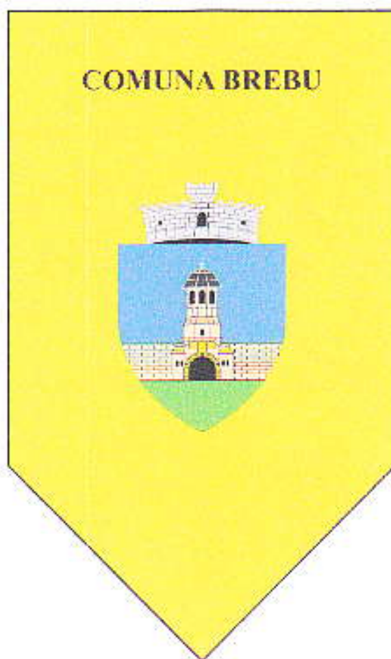
FANIONUL COMUNEI BREBU- VARIANTA II STEMA COMUNEI BREBU PE FOND GALBEN